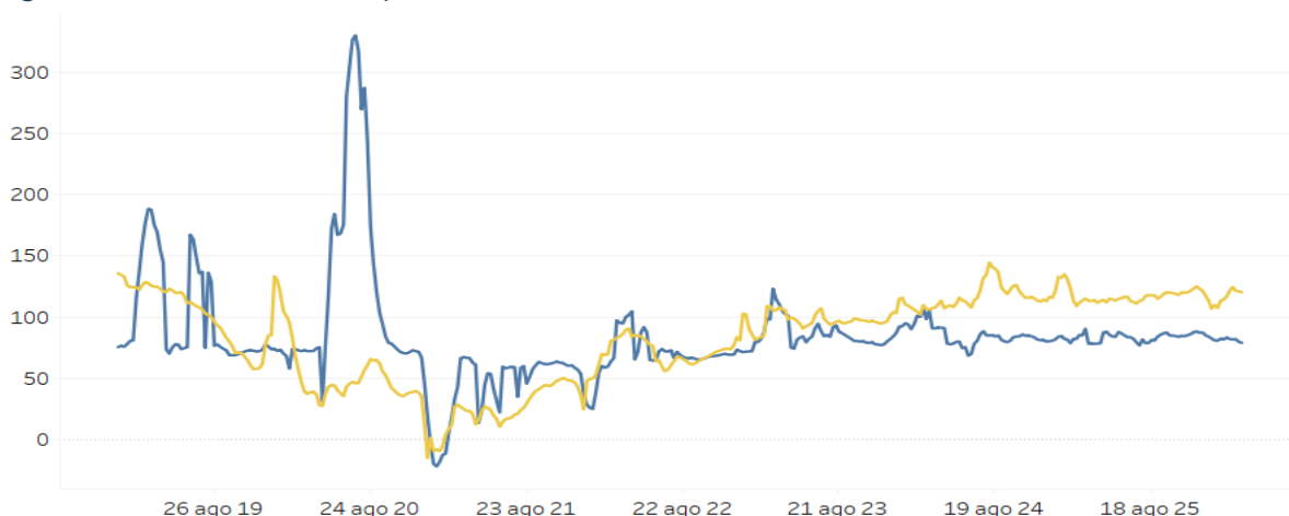
Figura 1 – Interesse per vacanze in Sardegna espresso dalle ricerche su Google (serie settimanale destagionalizzata, media 2019=100)